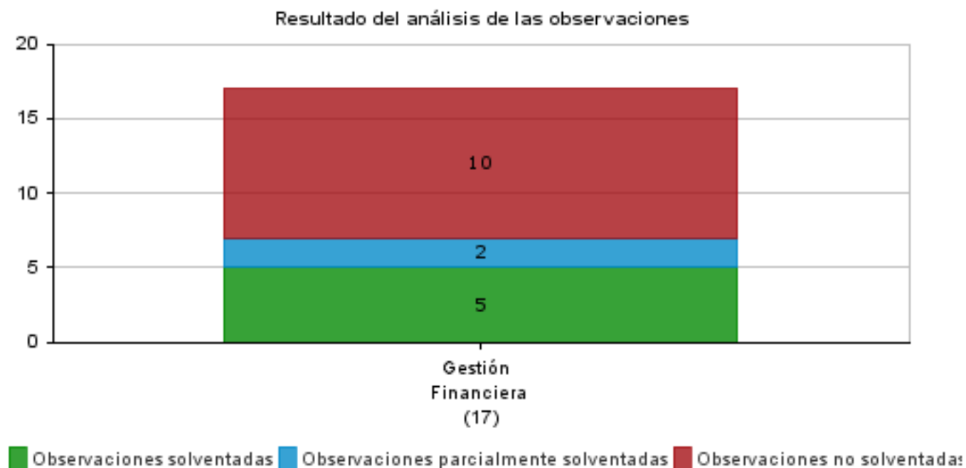
GRÁFICA: Observaciones por tipo de auditoría

Asimismo, en función de las observaciones detectadas durante la fiscalización de la Cuenta Pública, en el siguiente CUADRO se presentan de manera sintetizada los resultados generales de la revisión.